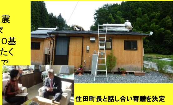
住田町長と話し合い寄贈を決定