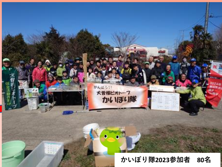
かいぼり隊2023参加者 80名

バス 綾瀬駅ー八潮市役循環で「関屋」下車5分 (駐車場は、下流側入り口の土手に5台ほどです)